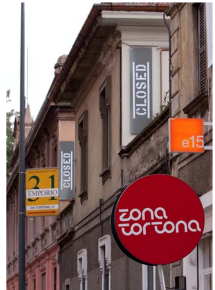
Via Tortona, 31 location dell'evento Sparkling! ecologically correct

alimentare per l'infanzia "Cucinando s'impara" all'interno dello spazio Sparkling! ecologically correct. L'evento ha rappresentato una sorta di "guida al consumo critico" ospitando quelle aziende che hanno adottato un nuovo modello di sviluppo, più rispettoso nei confronti del sociale e dell'ambiente, con lo scopo di promuovere un consumo più consapevole.